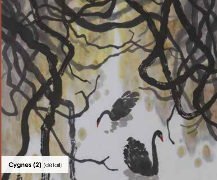
Cygnes (2) (détail)