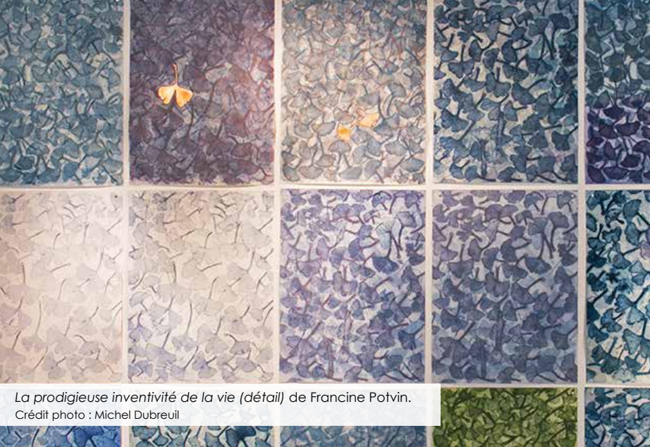
La prodigieuse inventivité de la vie (détail) de Francine Potvin.