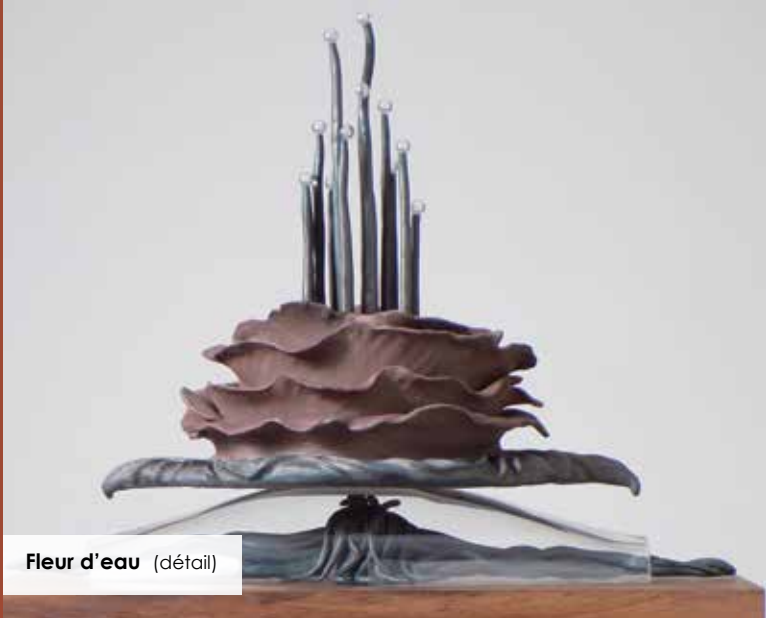
Fleur d'eau (détail)