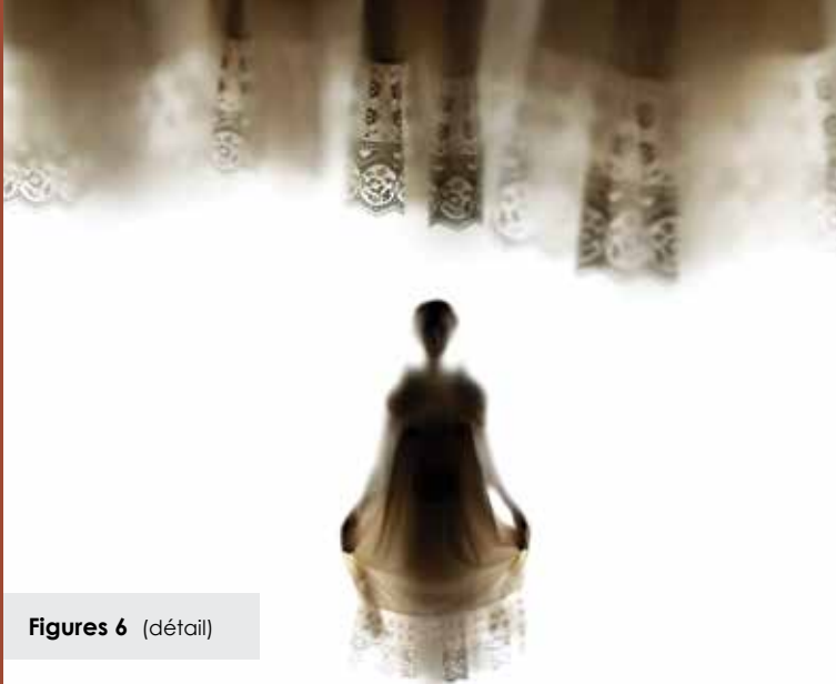
Figures 6 (détail)