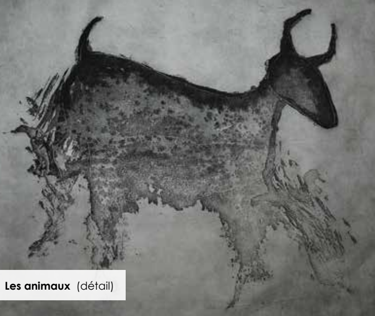
Les animaux (détail)

24 février au 31 mars Galerie Renée-Blain