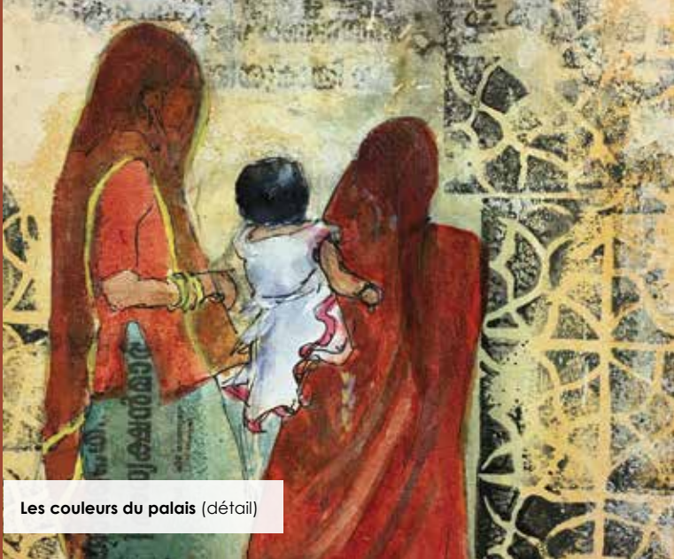
Les couleurs du palais (détail)

10 mai au 29 juin Espace Mur-mur des arts