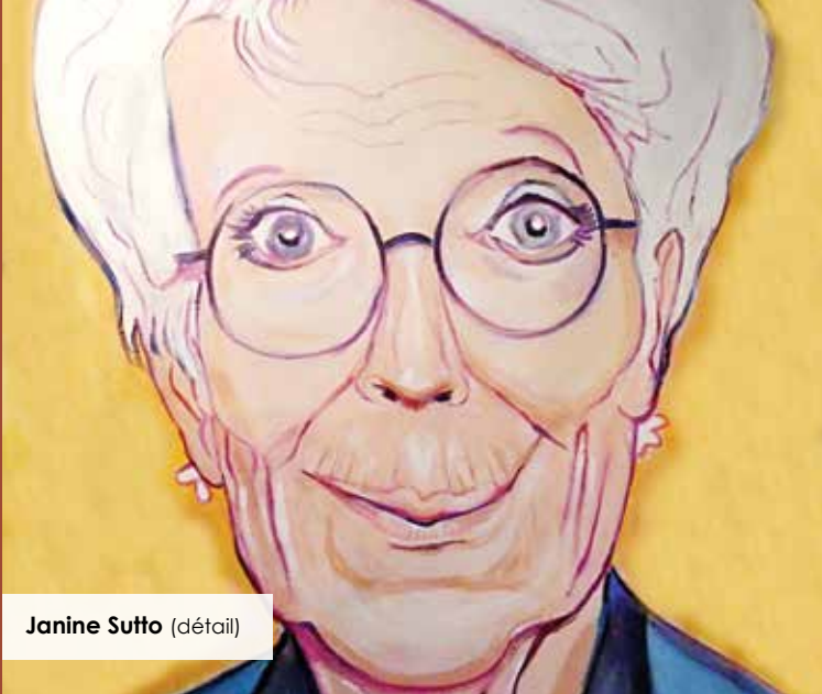
Janine Sutto (détail)