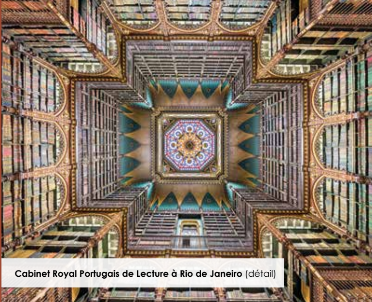
Cabinet Royal Portugais de Lecture à Rio de Janeiro (détail)